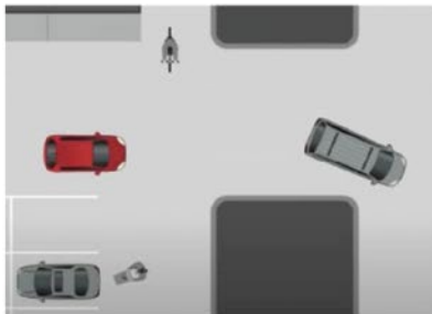
Carreteras en zonas comerciales