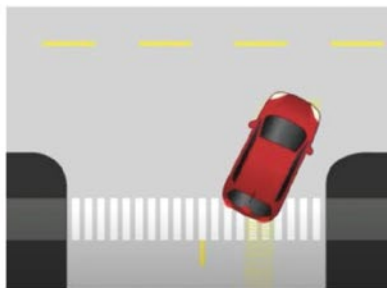
Carreteras en zonas residenciales